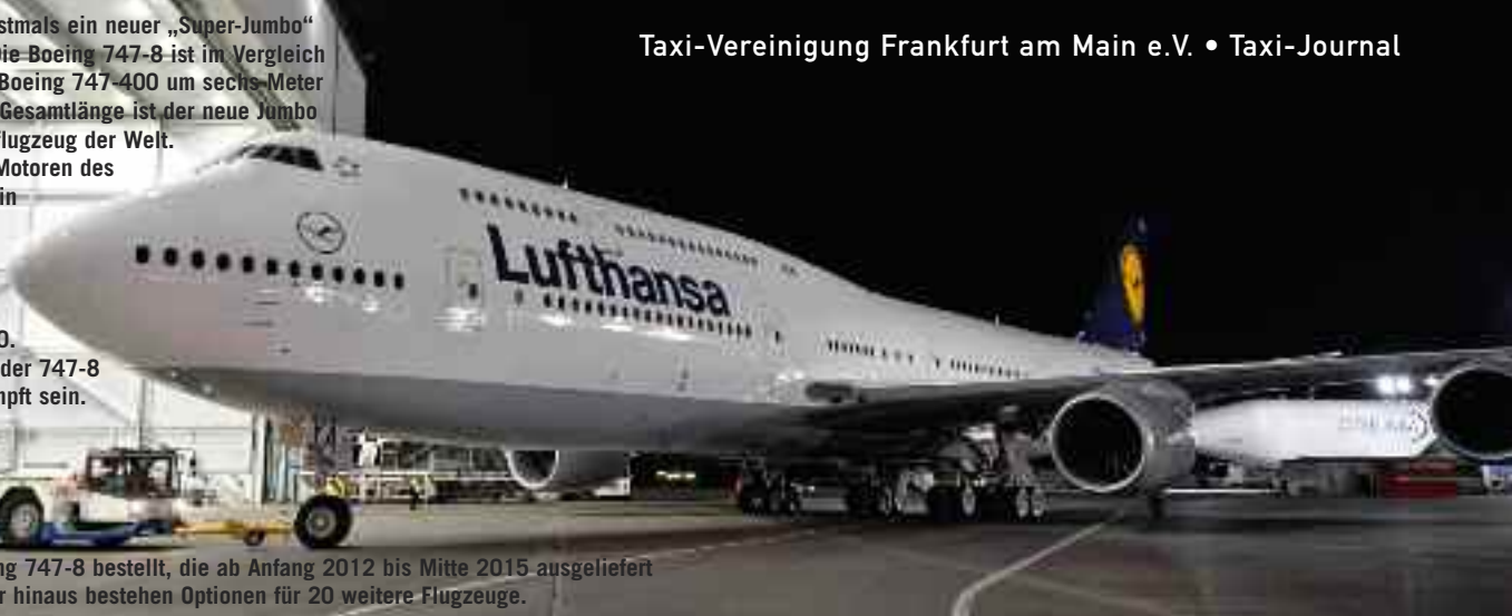
Lufthansa hat 20 Boeing 747-8 bestellt, die ab Anfang 2012 bis Mitte 2015 ausgeliefert werden sollen. Darüber hinaus bestehen Optionen für 20 weitere Flugzeuge.

Am 6. Dezember ist erstmals ein neuer „Super-Jumbo“ in Frankfurt gelandet. Die Boeing 747-8 ist im Vergleich zum Vorgängermodell Boeing 747-400 um sechs Meter gestreckt. Mit 76,3 m Gesamtlänge ist der neue Jumbo das längste Passagierflugzeug der Welt. Die neu entwickelten Motoren des Typs GEnx-2B67 und ein neues Tragflächprofil sollen die 747-8 um 13 Prozent treibstoffeffizienter fliegen lassen als die 747-400. Auch der Lärmteppich der 747-8 soll um 30% geschrumpft sein.