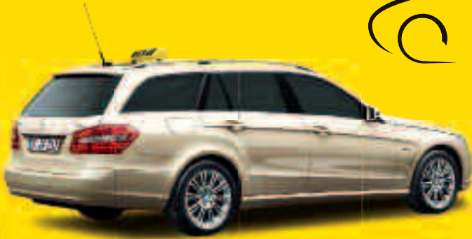
Das E 200 CDI BlueEFFICIENCY T-Modell 1 Gewinner in der Kategorie „Taxi-Limousine, Kombi und Kompaktvan“