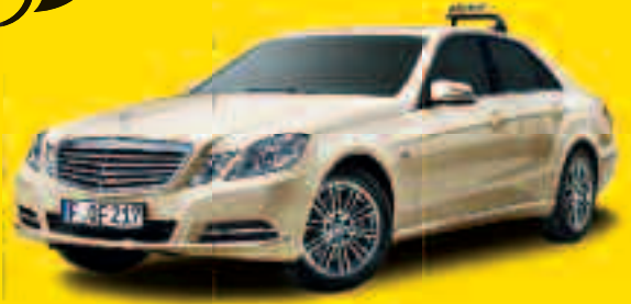
Der E 200 NGT BlueEFFICIENCY 2 Gewinner in der Kategorie „Taxi mit alternativem Antrieb“